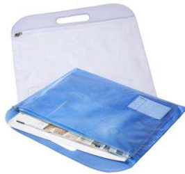
TABLA MEDICA "GUARD"