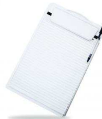
TABLA DE CAMPO