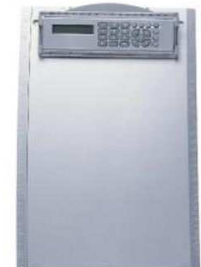
TABLA PARA HOJAS CON REGLA DE 28 CM.