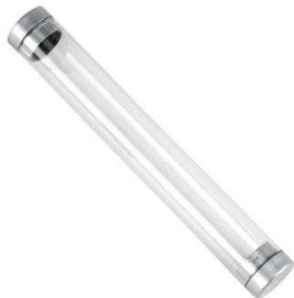
FIGURA ANTIESTRES CON PORTABOLÍGRAFO E IMÁN